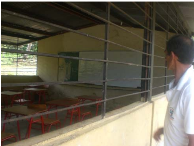
Las aulas no tiene vidrios y los niños reciben clases así a la intemperie.