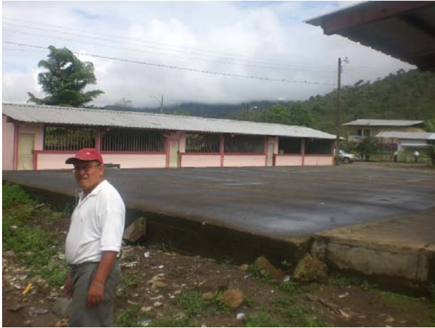
Esta es la escuela elemental y su director, completamente al aire libre y sin ningun cerramiento, confundíendose la escuela con la comunidad.