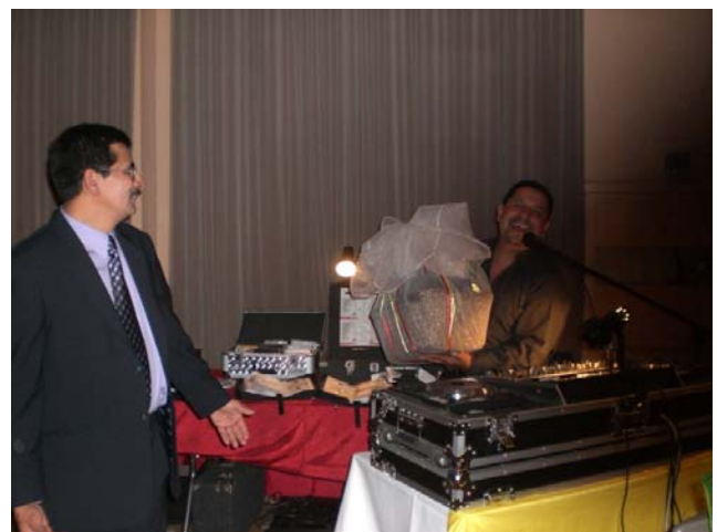
Hasta nuestro DJ ganó un premio. Se lo tenía bien merecido por tanta colaboración en beneficio de los necesitados en Ecuador.