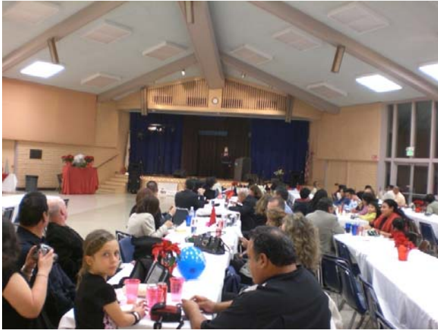
El Foley Cultural Center estuvo decorado por Imeda Granda. Muchas gracias por su colaboración.