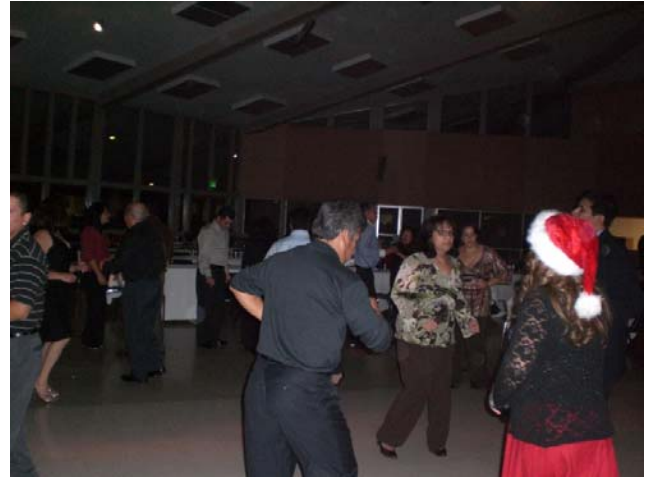
Más bailarines, que lo pasaron de lo mejor.